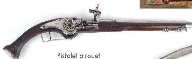
Pistolet à rouet