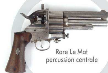
Rare Le Mat percussion centrale