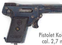
Pistolet Kolibri cal. 2,7 mm