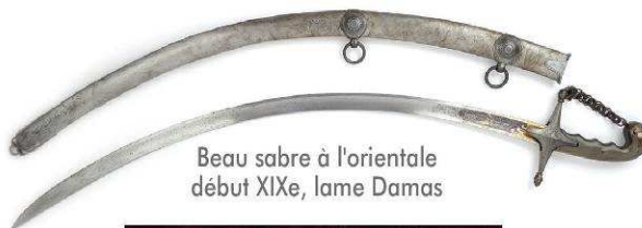
Beau sabre à l'orientale début XIXe, lame Damas