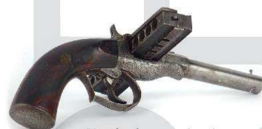
Pistolet harmonica Jarre