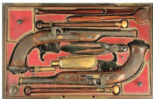
LEPAGE Coffret de pistolets à percussion