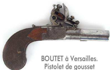
BOUTET à Versailles. Pistolet de gousset