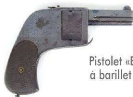
Pistolet «BAR» à barillet plat