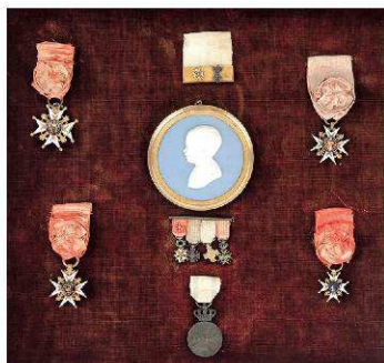
Tableau de décorations : Ordre de St Louis et Lys