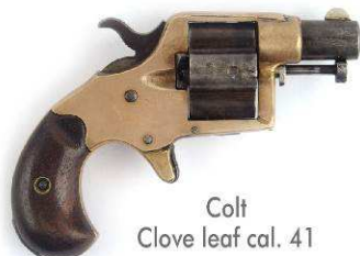
Colt Clove leaf cal. 41